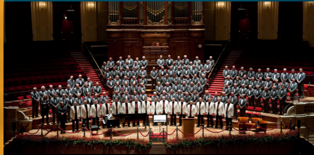
CHR. WADDINXVEENS MANNENKOOR 'DE GOUWESTEM'

Uniek is het optreden van het 'Berliner Männerchor'! Een mannenkoor, dat speciaal voor deze reis, een bijzonder repertoire zal instuderen. De zangers zijn afkomstig van het Zaans Interkerkelijk Mannenkoor, Chr. Streekmannenkoor Noord-West Veluwe en Chr. Waddinxveens Mannenkoor De Gouwestem. Maar ook u kunt deelnemen aan dit mannenkoor! Wanneer u graag wilt meedoen en in de aanloop naar de reis minimaal 5 repetities van één van voornoemde koren bezoekt, kunt u meezingen in het 'Berliner Männerchor'. Geef op uw inschrijfformulier dan wel duidelijk aan dat u geen lid bent van een mannenkoor van Martin Mans, maar wel graag wil meezingen!