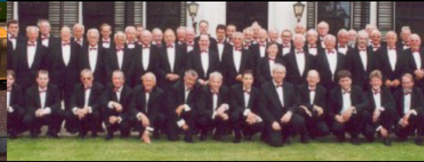
CHRISTELIJK STREEKMANNENKOOR NOORD-WEST VELUWE