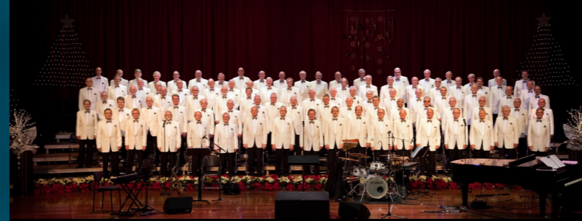
ZAANS INTERKERKELIJK MANNENKOOR