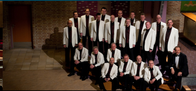
THE MARTIN MANS FORMATION