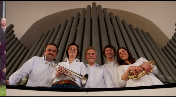
THE MARTIN MANS BAND